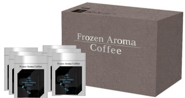
〈荷姿〉冷凍宅急便でお届け